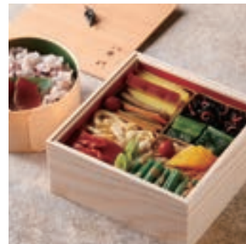
健康志向でヘルシーに仕上げた 八千代的美膳弁当