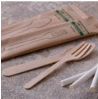
本館で使用している 木製フォーク、スプーン、紙ストロー